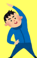
作業療法士によるミニ講話